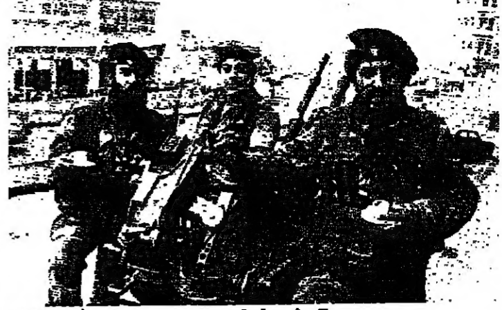
شرب قهوة ■ سجن عراقي